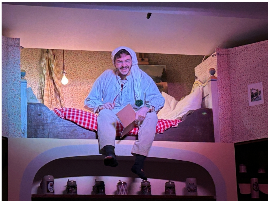
War er nicht genial ...

Es war heuer, um mit den Worten unseres Malers und Dichters Simpl zu sprechen, „einfach genial“. Das diesjährige Stück „Umdraht“ wird auf jeden Fall einen Platz in unserer „Ewigen Theaterbestenliste“ einnehmen.