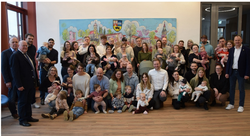
Text&Foto: Gemeinde Ebermannsdorf

21 Neugeborene in 2025 wurden zum Begrüßungsgeld 2026 mit Ihren Familien eingeladen.