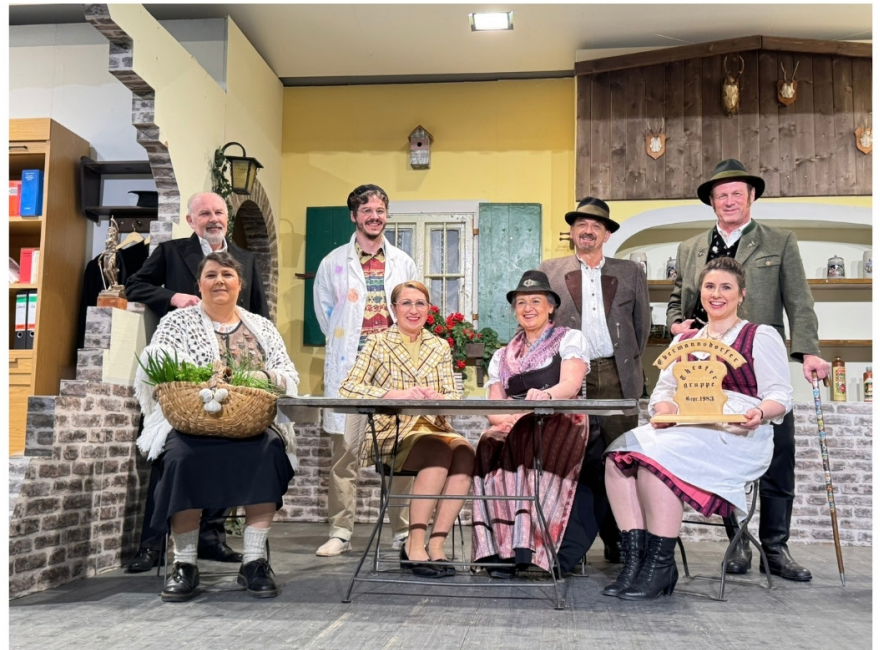
... genauso wie wir alle

Jetzt lassen wir die Saison etwas sacken und dann sehen wir optimistisch in die Theaterzukunft. Der viele Zuspruch und die zahlreichen positiven, ja manchmal sogar euphorischen Rückmeldungen lassen uns ja gar keine andere Wahl. Freuen wir uns mit Ihnen auf die nächste Fortsetzung!