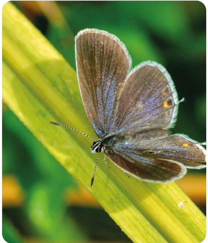
Text: Beate May, Bund Naturschutz Ebermannsdorf (BN) Fotos kurzschwänziger Bläuling-Wolfgang Piepers; Eisvogel-Christoph Bosch

An den nahegelegenen Hügelgräbern lassen sich außerdem verschiedene Tagfalterarten entdecken, darunter der kurzschwänzige Bläuling und der Magerrasen-Perlmutterfalter. Diese seltenen Funde zeigen eindrucksvoll, wie wertvoll und lebendig dieses kleine Biotop direkt vor unserer Haustür ist.