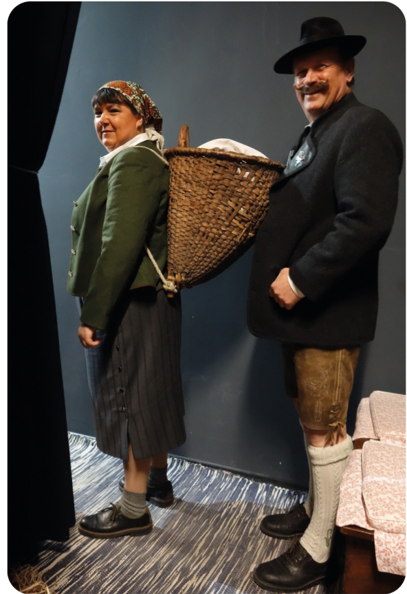
Auch wer nicht auf der Bühne ist, fiebert mit

Das steht logischerweise auch noch nicht fest. Zumal bei jedem auch immer was dazwischenkommen kann. Aber wir werden auch dieses Mal bestimmt wieder eine schlagkräftige und motivierte Truppe hinbekommen, so dass Sie im Frühjahr sicher was zu lachen haben werden. Wer von Ihnen Lust und Laune hat, auch mal selbst dabei zu sein - ob als Spieler oder Helfer - soll sich auf jeden Fall gerne bei uns melden. Die Proben werden sicher erst deutlich nach Erscheinen des Gemeindeblatts beginnen und für Nachwuchsspieler jeden Alters sind wir immer offen.