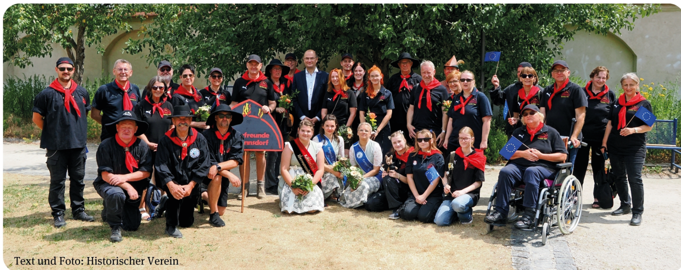
Text und Foto: Historischer Verein