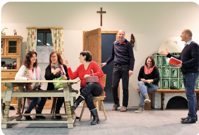
Bei den Proben geht's oft lustig her

Im Frühjahr gibt es Theater in Ebermannsdorf – Oder: Wann ist denn bald Ostern?